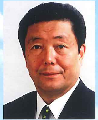
塾長 衆議院議員/自民党鹿児島県連会長