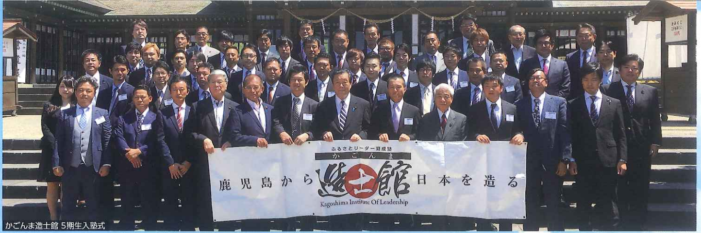
かごんま造士館 5期生入塾式