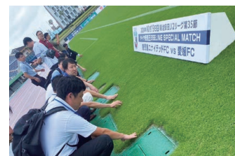
③鹿児島ユナイテッドFC