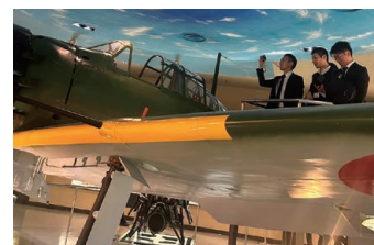
④海上自衛隊鹿屋航空基地