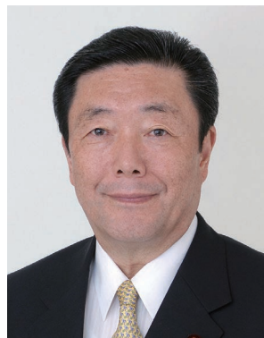
衆議院議員／ 自民党鹿児島県連会長

「鹿児島から日本を造る」という気骨にあふれる皆さんが、当塾の質の高い研修カリキュラムの中で互いに切磋琢磨し合い、大いに研鑽を積んで、日本の抱える内外の課題を打開する土(さむらい)となり、これからの鹿児島の各界のリーダーとして成長されることを心から祈念申し上げ、ご挨拶いたします。